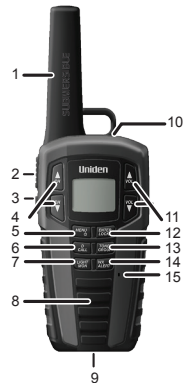
La couleur de la radio/motif varie selon le numéro de modèle.

* La portée peut varier selon l'environnement ou les conditions topographiques.